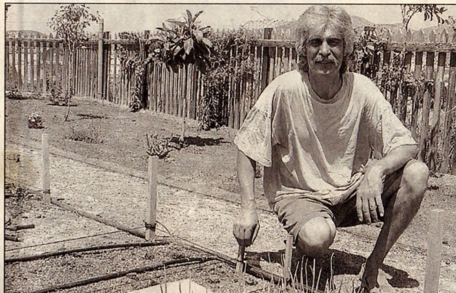
El último huerto municipal de Sant Llorenç se ha ubicado en la antigua estación de tren.